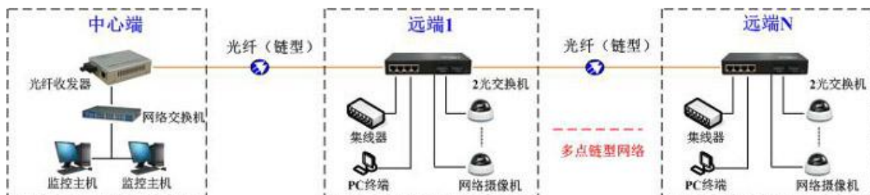
方案一：光纤多点组链型网络